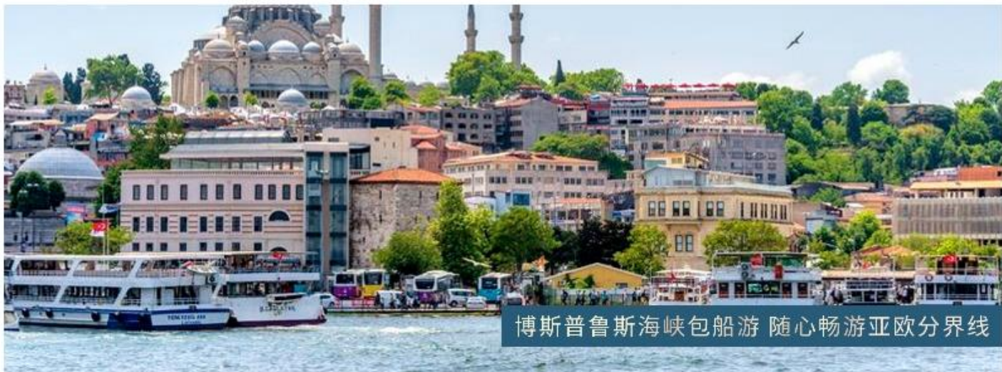
博斯普鲁斯海峡包船游 随心畅游亚欧分界线

多玛巴切新皇宫 巴洛克和新古典主义风格相融合的奥斯曼帝国皇宫 网红拍照地—伊斯坦布尔巴拉特彩色街区